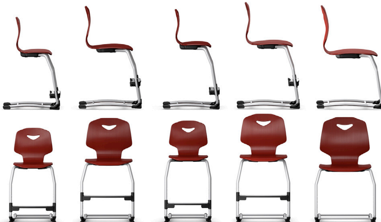
Schülerstühle für 71 cm hohe Tische